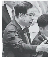
質問する志位議長=衆院予算委

自衛隊と米軍の作戦や能力の「シームレスな(切れ目のない)統合を可能」にすることに合意した日米首脳会談。共産党の志位和夫議長は危険な中身を衆院予算委員会で告発しました(4月22日)。