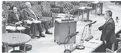
岸田首相(左)に質問する小池書記局長(右)=参院予算委

岸田派は3000万円を超える政治資金収支報告書への不記載があります。小池氏は「何よりも総理は自民党の最高責任者である総裁であり、主要派閥ぐるみの裏金づくりに特別の責任がある。何の処分もなしで国民が納得できるわけがない」と指摘。「最高責任者がまず処分を受けるのが当然。トカゲの尻尾を切って自らの延命を図ろうとしている」と批判しました。