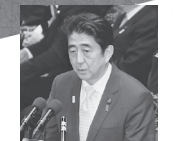
衆院予算委員会で答弁する安倍首相(当時)=2013年2月7日