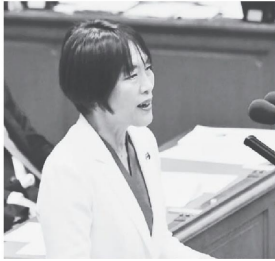
岸田首相との党首討論に臨む田村智子委員長=19日