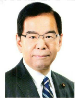
衆議院議員 志位和夫