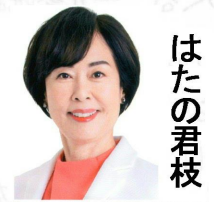
前衆議院議員 はたの君枝