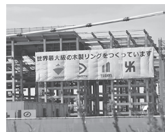
万博会場のリング

導、物流倉庫や商業施設を一時滞在施設として活用します。万博の“売り”であるリング(高さ最大20メートル)は「落雷の危険性が高い」としています。