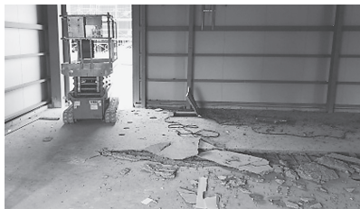
夢洲1区の爆発現場

来年4月開幕の大阪・関西万博。会場が現役の産廃処分場の人工島=夢洲 ゆめしま であることによる問題が噴出。矛盾が拡大することは必至。万博は中止しかありません。