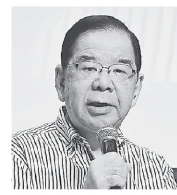
報告する志位和夫議長=7月24日

高まる東アジアの軍事的緊張。日本共産党の志位和夫議長は、どうやって戦争の心配のない東アジアをつくるのかについて発言しました（7月24日のシンポ）。いま「平和の準備」こそ必要です。