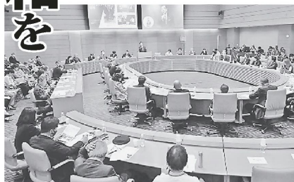
「東アジア平和提言」が発表された講演会=4月17日