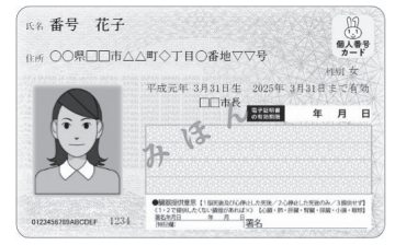
デジタル庁のホームページより

まったく問題ありません。今の健康保険証の有効期限まではこれまで通り医療を受けられます。また、有効期限が切れる前には、加入する医療保険から「資格確認書」が申請なしで交付されます（有効期間は5年以内）。