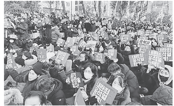
7日、ソウルの国会前に集まり尹大統領の弾劾を求める市民たち

韓国国会は7日午後、本会議を開き、「非常戒厳」を宣言した尹錫悦大統領の弾劾訴追案を