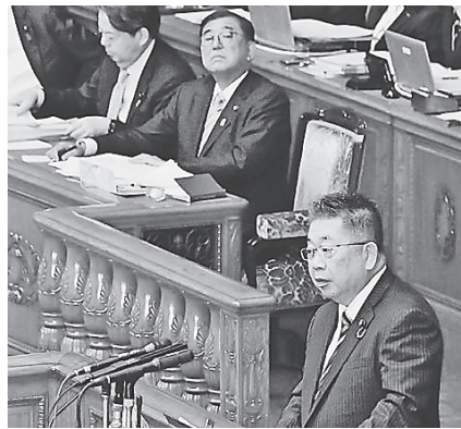
代表質問に立つ小池晃書記局長、その奥は石破茂首相=4日、参院本会議

また、「国民の前に立ちふさがる壁は103万円だけではない」と強調し、大企業や富裕層を優遇してきた税制全体のゆがみを正せと主張。消費税減税、