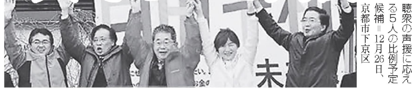
聴衆の声援に応える5人の比例予定候補。12月26日、京都市下京区