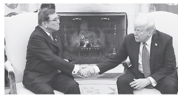
トランプ大統領と会談する石破首相=7日、ワシントン

石破茂首相とトランプ米大統領との初の首脳会談。日米首脳共同声明では「日米同盟の抑止力・対処力をさらに強化していく」と明記。日本の軍事費がGDP比2%に倍増する見込みの2027年度以降も、「防衛力を抜本的に強化していく」として、さらなる軍事費増を対米誓約しました。米国は北大西洋条約機構(NATO)加盟国にGDP比5%の軍事費を要求しており、日