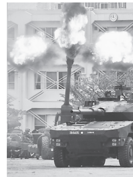
大津駐屯地の展示訓練で放たれる155ミリ榴弾砲。24年4月27日

滋賀県高島市の饗庭野演習場で3日、陸上自衛隊が実施した155ミリ榴弾砲射撃訓練中に、砲弾の一発が目標地点を外れ、着弾場所が確