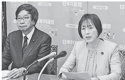
記者会見する田村智子委員長(右)と大門実紀史参院議員=6日、国会内

日本共産党の田村智子委員長は6日、「人間らしく暮らせる賃金と労働時間短縮のために力を合わせよう」と訴えるアピールを発表。「労働者のたたかいで収入も自分の時間も増やそう。中小企業も含む全てのみなさんの賃上げ実現のため政治を変えよう」と呼びかけました。大門実紀史参院議員も同席しました。