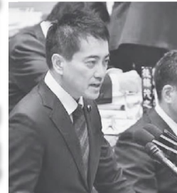
質問する辰巳孝太郎議員 =3日、衆院予算委

日本共産党の辰巳孝太郎議員は衆院予算委で3日、自民、公明、維新が医療費の最低4兆円削減で合意したことに関し、「医療崩壊が起こる」と指摘。2008年に出産間近の妊婦が7つの医療機関に受け入れを拒否され死亡した事件を例にあげ、「06年の1兆円の削減が現場の心を折り医療崩壊をもたらした」「1兆円で医療崩壊だ。4兆円の削減が一体どれだけの痛みをもたらすのか」と追及しました。